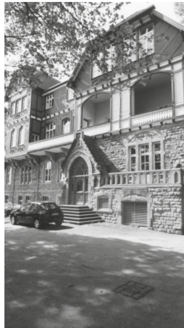
Johanna-Helene-Heim der Ev. Stiftung Volmarstein